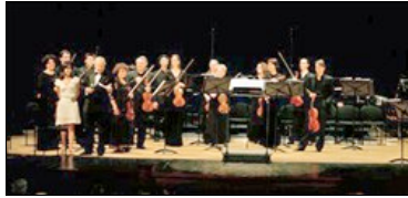
LOS MÚSICOS en el Teatro Heredia.